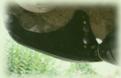
Montage avec patins skis: