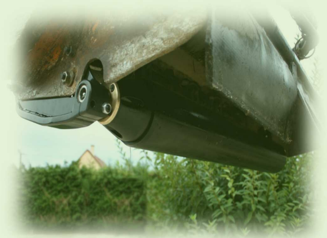
Montage sur groupe 1.20 m type premium