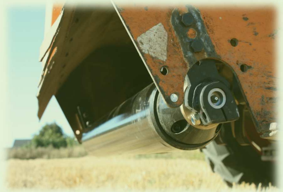
Montage sur rotofaucheuse DMG 60-74